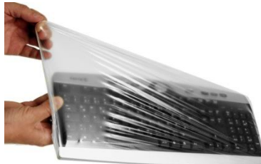
2. Schutzfolie über Tastatur ziehen